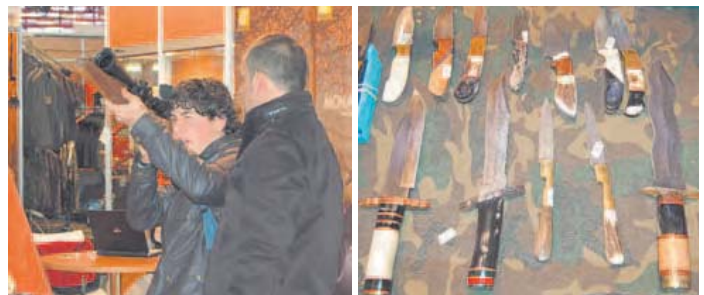
El entretenimiento está garantizado en este tipo de ferias. Y es que los asistentes pueden contemplar desde los siempre atractivos fusiles militares rusos, hasta las clásicas carabinas Marlin, pasando por las numerosas empresas de ópticas y accesorios de caza que exponen sus productos.