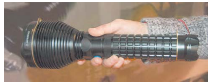
La linterna Olight SR90 Intimidator de 2.200 lumens tiene un tamaño realmente impresionante.